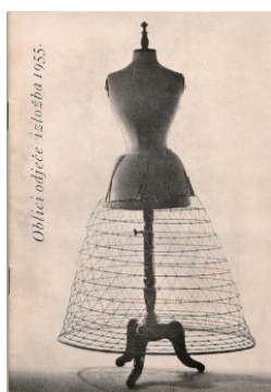
Oblici odjeće izgleda 1955.