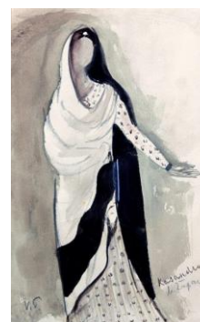
Trojanskog rata neće biti Skica 1952.