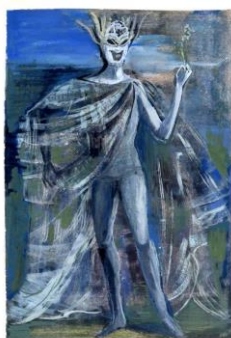
San Ljetne noći 1962.